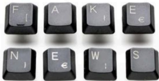
Salute: 'la verità è più di un consiglio', convegno a Roma contro fake news

Roma, 8 mar. (AdnKronos Salute) - Il dilagare delle fake news rappresenta un rischio crescente per la salute dei cittadini. Per contrastare questo fenomeno l'antidoto più efficace rimane la corretta informazione. Dai vaccini alle malattie rare, dalle terapie per i tumori alle regole per un'alimentazione equilibrata, sono tanti gli ambiti in cui è possibile diffondere false notizie che possono mettere a rischio la salute dei cittadini. Ecco perché il 12 marzo alle 11 si terrà a Roma, al Palazzo dell'Informazione, la tavola rotonda 'True news, good news. Salute e informazione, quando la verità è più di un consiglio', promossa da AdnKronos con il contributo non condizionante di Takeda Italia. Istituzioni, società medico-scientifiche, aziende e opinion leader attivi nella lotta alle fake news presenteranno progetti, iniziative e strumenti ad hoc realizzati per riconoscere fonti attendibili ed evitare informazioni false e dannose.