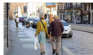
Salute: Federazione Alzheimer, una guida per usare 'le parole giuste'