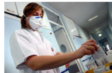
Meningite: Reggio Emilia, ragazza 19enne muore per sepsi