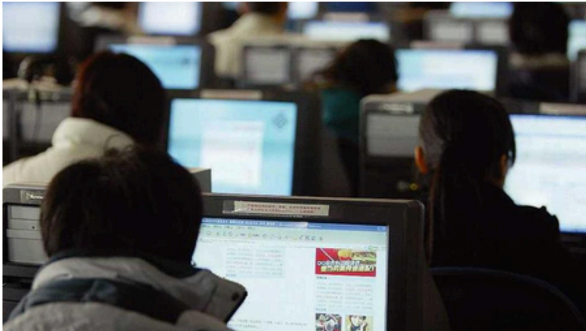
L'accessibilità garantita da Internet non sempre coincide con informazioni corrette.

Aumentano le bufale e le trappole rilanciate sui social: in un convegno l'allarme lanciato dagli oncologi