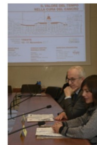
Gianpiero Fasola (Presidente Collegio Italiano Primari Oncologi Medici Ospedalieri - CIPOMO) e Debora Serracchiani (Presidente Regione Friuli Venezia Giulia) alla presentazione della conferenza "Il valore del tempo nella cura del cancro" - Trieste 07/11/2017

scarica il video | durata 2 min | [14MB]